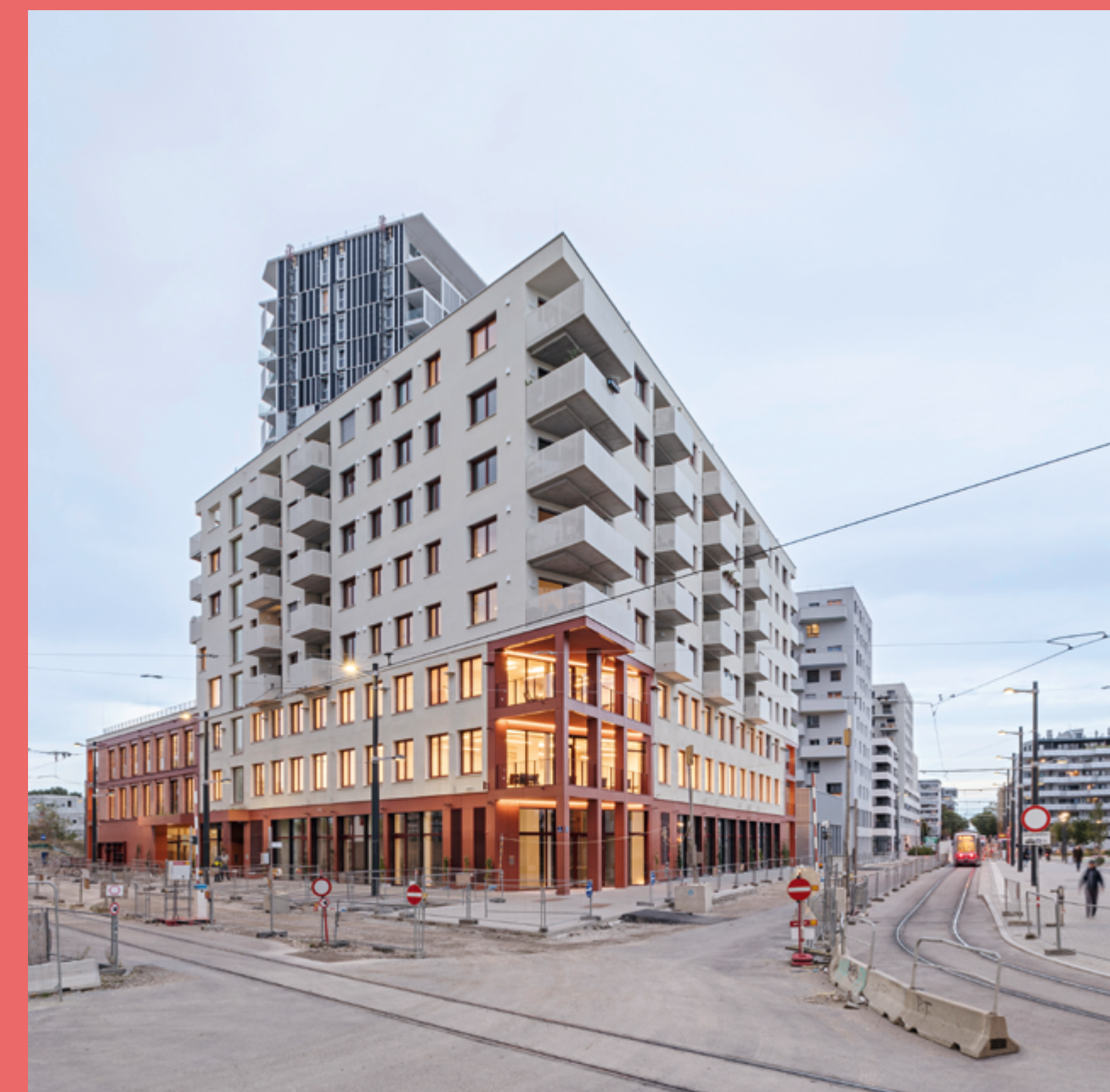
einszueins architektur Die HausWirtschaft, Wien, 2023