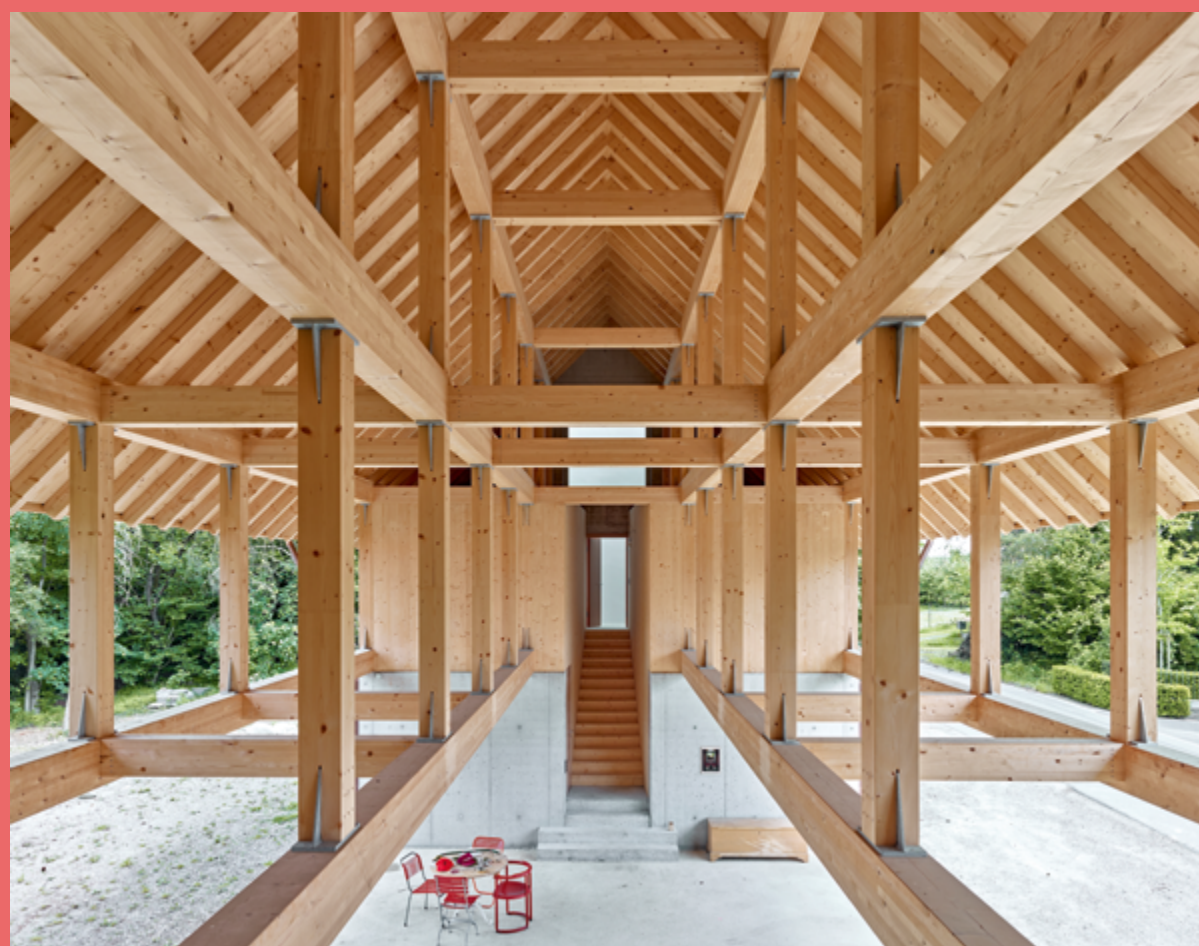
Stauer & Hasler Architekten Atelierwohnhaus Horben 7, Uesslingen-Buch, Schweiz, 2018