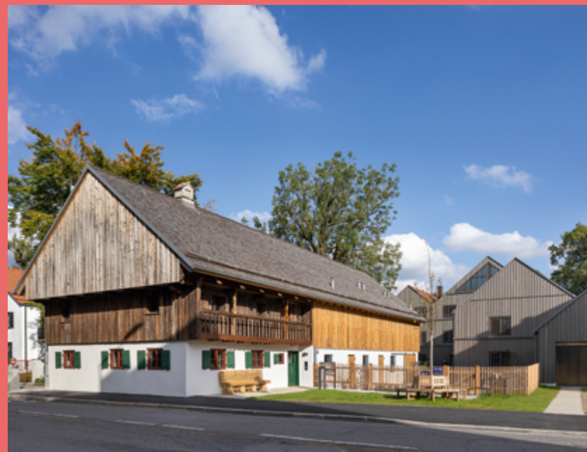
raumstation Architekten | Peter Haimerl Derzbachhof, München, 2022