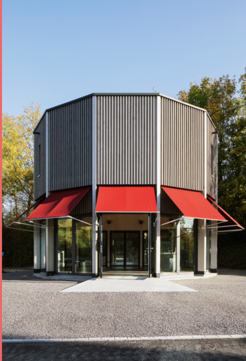
Lukas Imhof Abwasserreinigungs-Anlage Altenrhein, Schweiz, 2017–2040