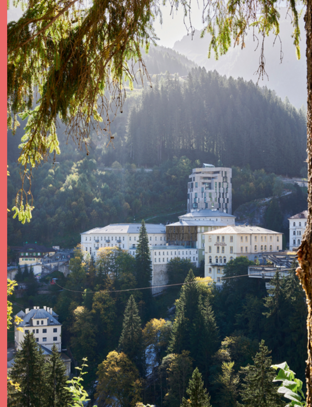
BWM Designers & Architects Hotelensemble Straubingerplatz, Bad Gastein, Salzburg, 2023