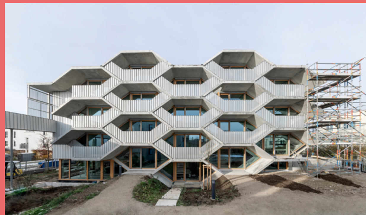
Peter Haimerl Wabenhaus, München, 2023