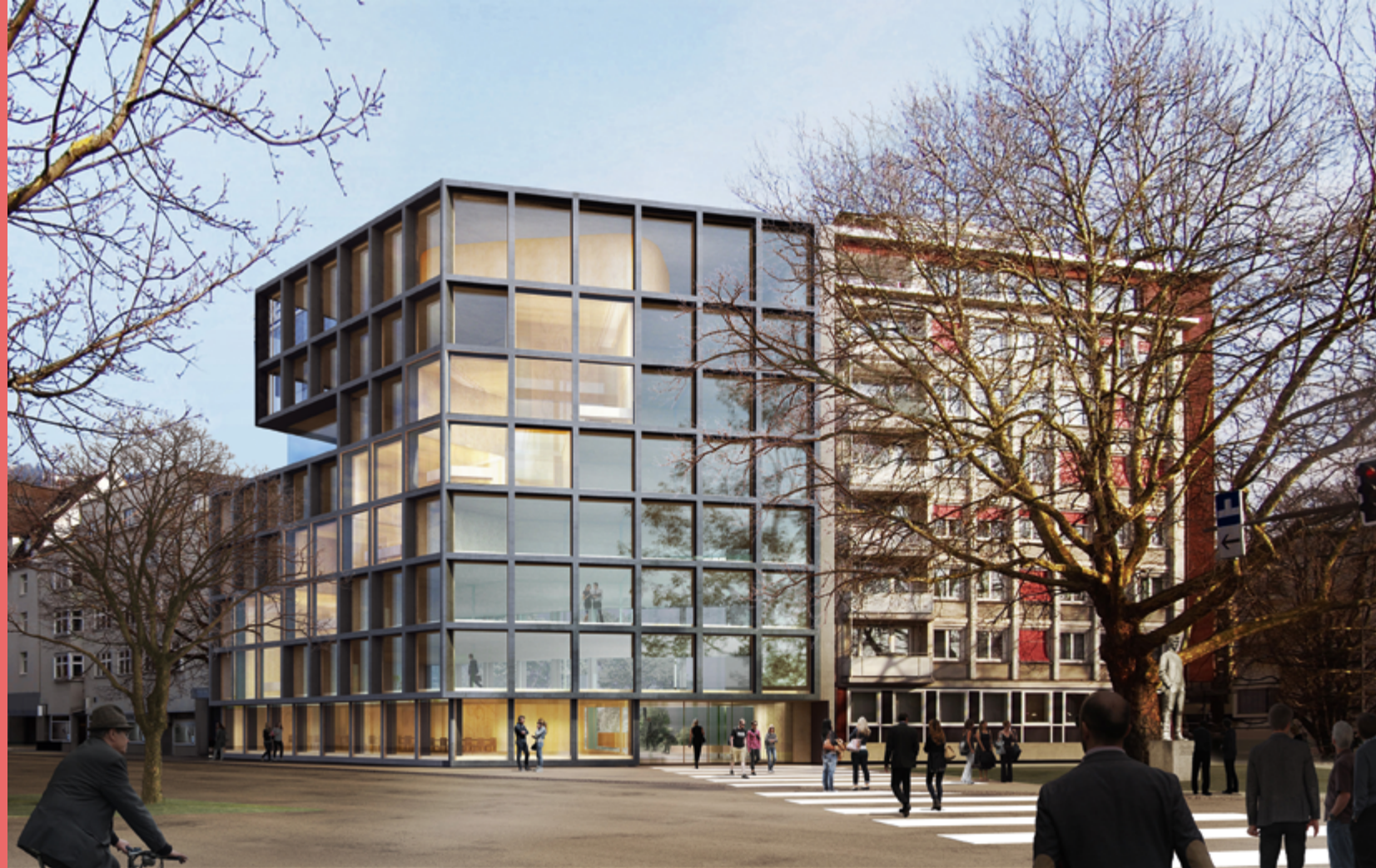
Dorner\Matt\Architekten VLV-Zentrale Bregenz, Vorarlberg, 2024 Visualisierung: Dorner\Matt\Architekten