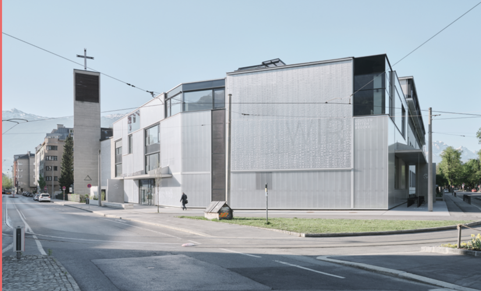
Studio Lois Schule Kettenbrücke Innsbruck, 2020