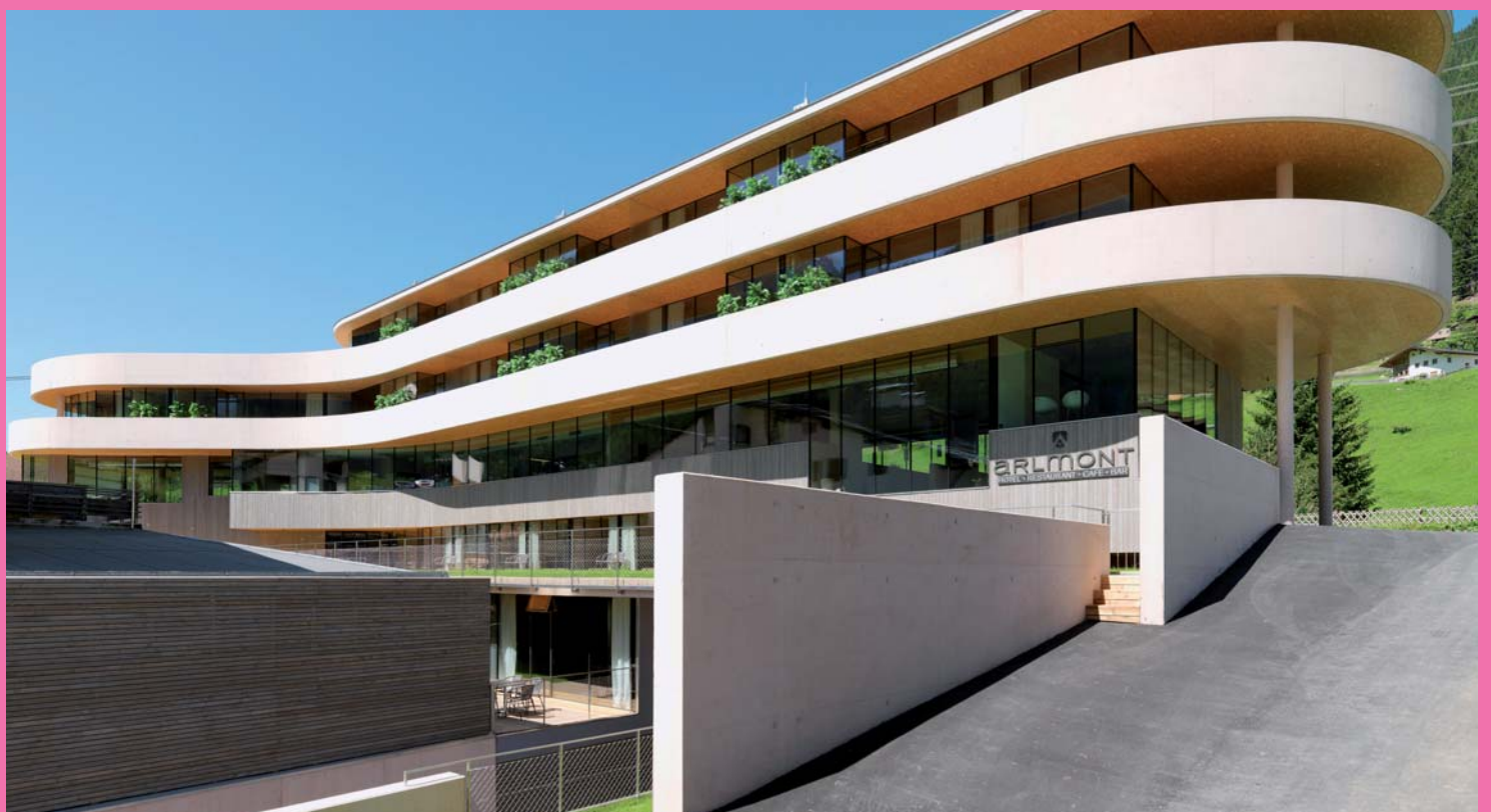
tatanka ideenvertriebsgmbh Hotel Arlmont, Tirol, 2009

Zusammenschau von Hotel und Neuem Dom ergibt aus den unterschiedlichen Perspektiven ein wechselndes, immer wieder eindruckliches Bild. Josef Hohensinn wollte mit dem solitären Baukörper eine zeitgemäße Antwort auf den mächtigen, neugotischen Kirchenbau geben. Mit dem leicht geknickten und daher etwas enigmatisch wirkenden Körper, der zwischen Schwere und Leichtigkeit, zwischen Massivität und Durchlässigkeit changiert, ist ihm dies auf subtile und zugleich kraftvolle Weise gelungen.