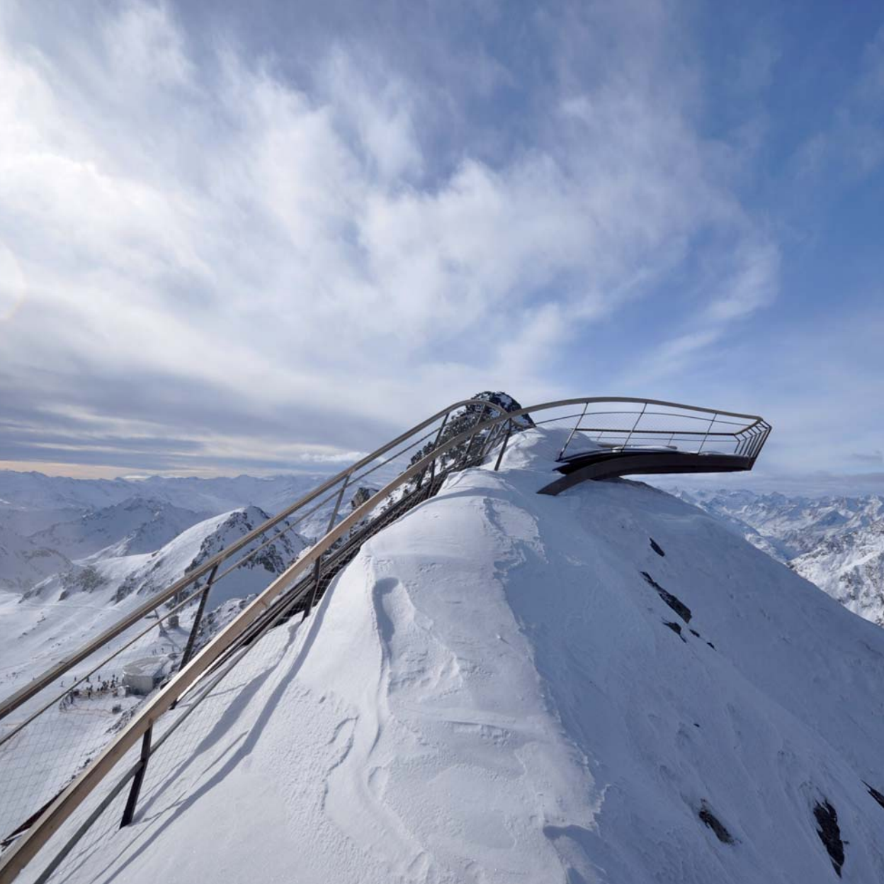
LAAC Architekten Gipfelplattform „Top of Tyrol“, Tirol, 2008 Foto: LAAC