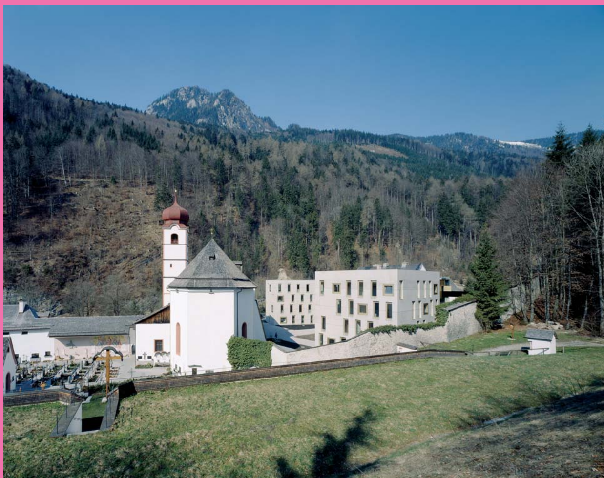
Marte.Marte Architekten Landessonderschule und Internat Mariatal Tirol, 2007