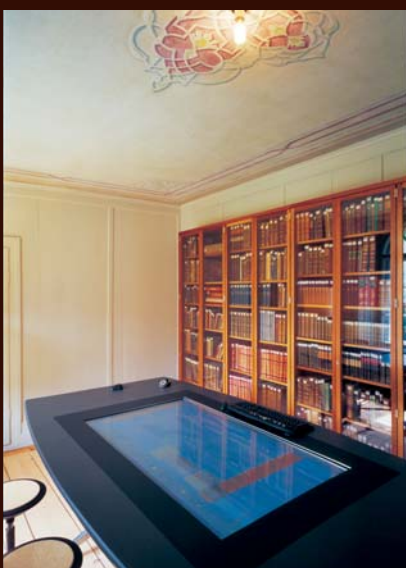
< Projektraum mit interaktivem Tisch im Tagungszentrum Villa Garbald der ETH Zürich Castasegna, Schweiz, 2005 Turn On Partner: Wilkhahn GmbH