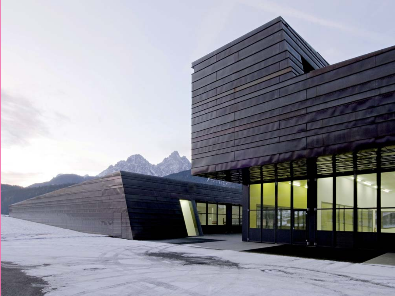
AllesWirdGut Zivildschutzzentrum Innichen, Italien, 2007