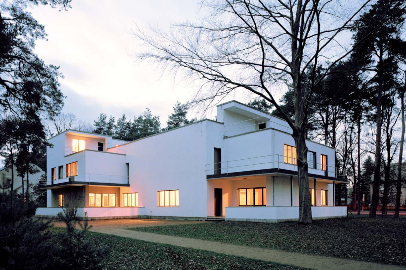
< Walter Gropius Meisterhaus, Dessau Deutschland, 1926 mit DLW Linoleum Turn On Partner: Armstrong DLW GmbH