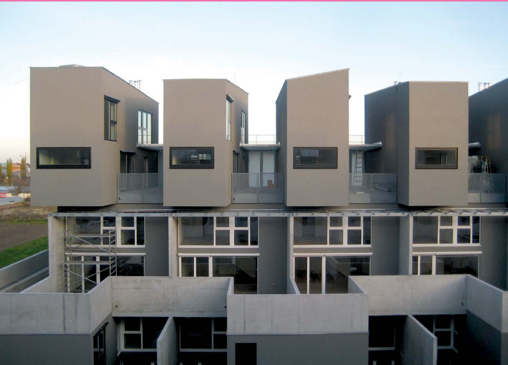
ARTEC Architekten Wohnbau „Die Bremer Stadtmusikanten“, Wien, 2010