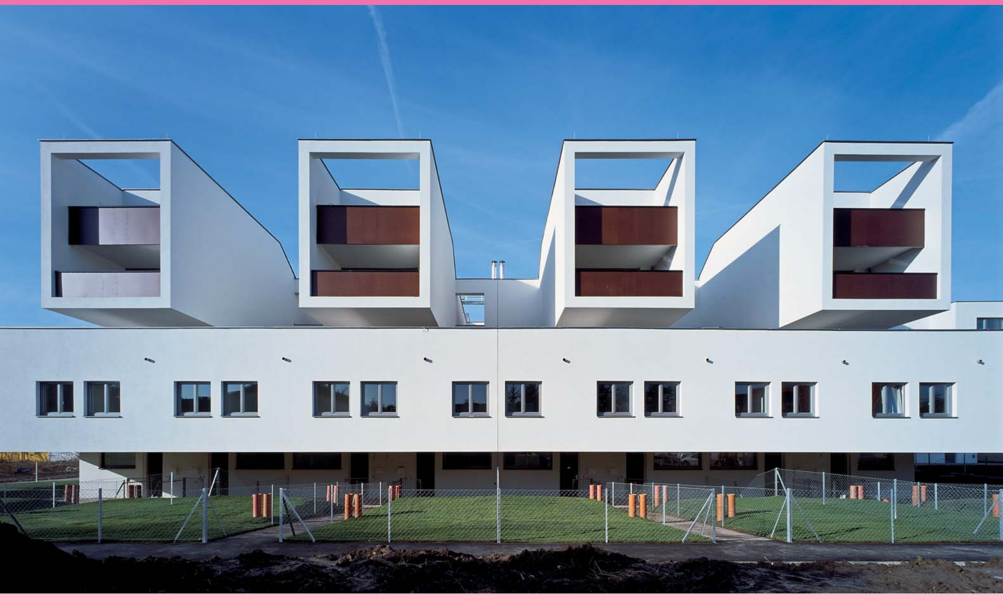
Walter Stelzhammer Wohnbau Orasteig, Bauteil A1, Wien, 2009