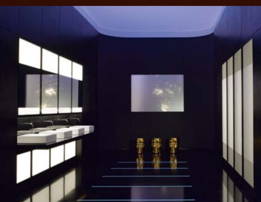
< Lykouria Design Flächig integrierter Waschplatz im Raum, 2009 Turn On Partner: Alape GmbH