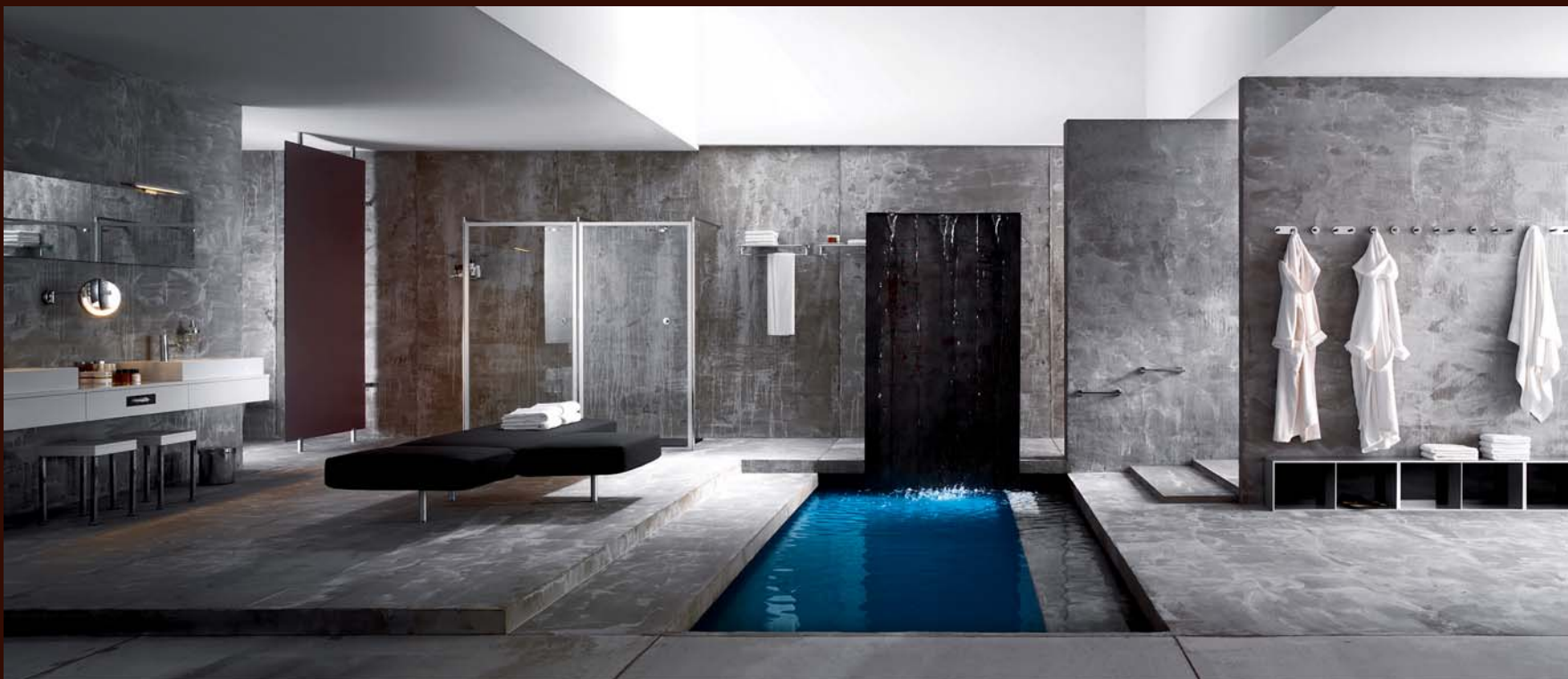
^ Badelandschaften, 2010 Turn On Partner: INDA s.r.l.