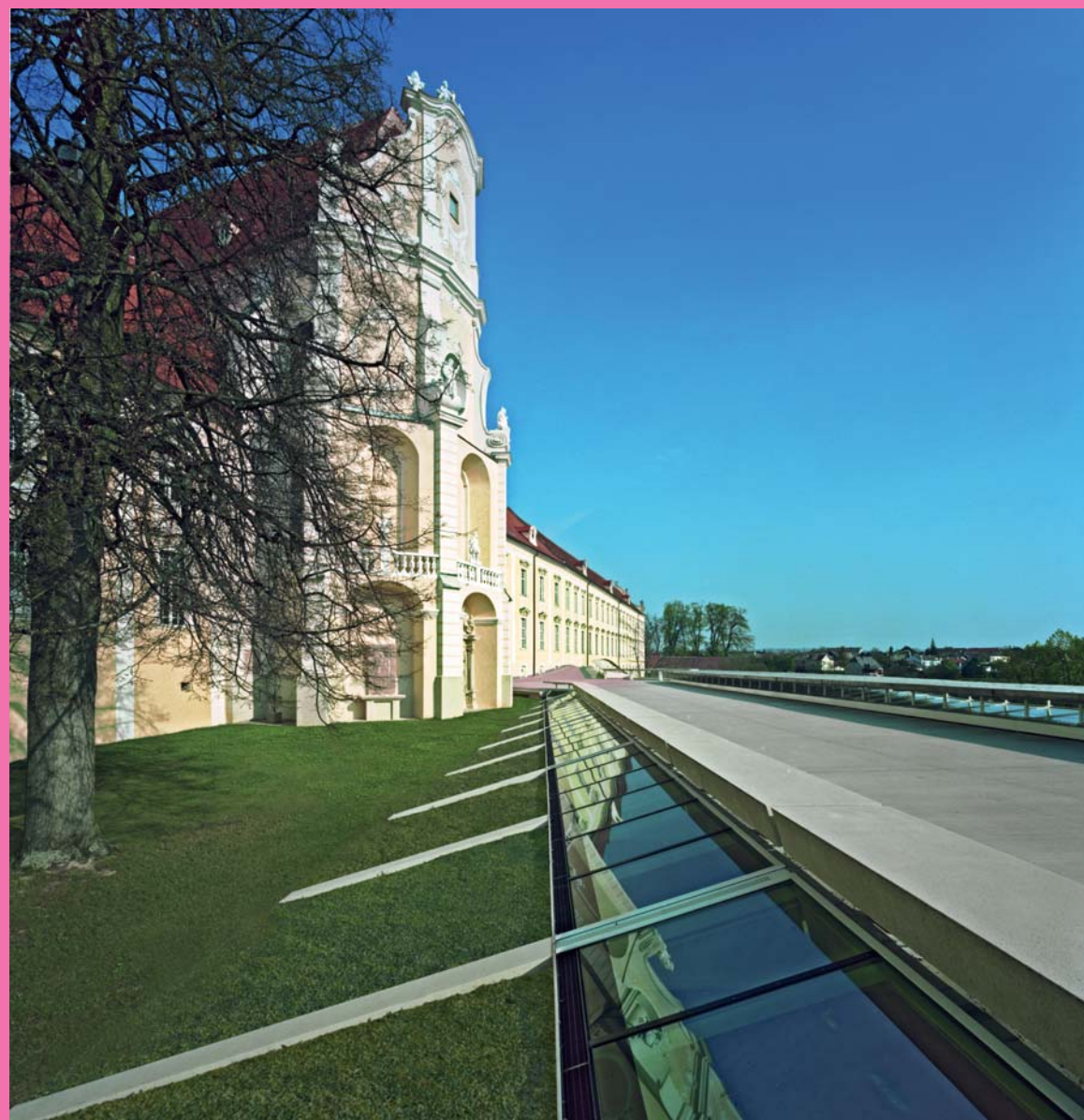
Jabornegg & Pálffy Stift Altenburg, Niederösterreich, 2009

Mit LAAC Architekten aus Innsbruck rückt das Thema Landschaft in einem komplexen Sinn in den Mittelpunkt. Kathrin