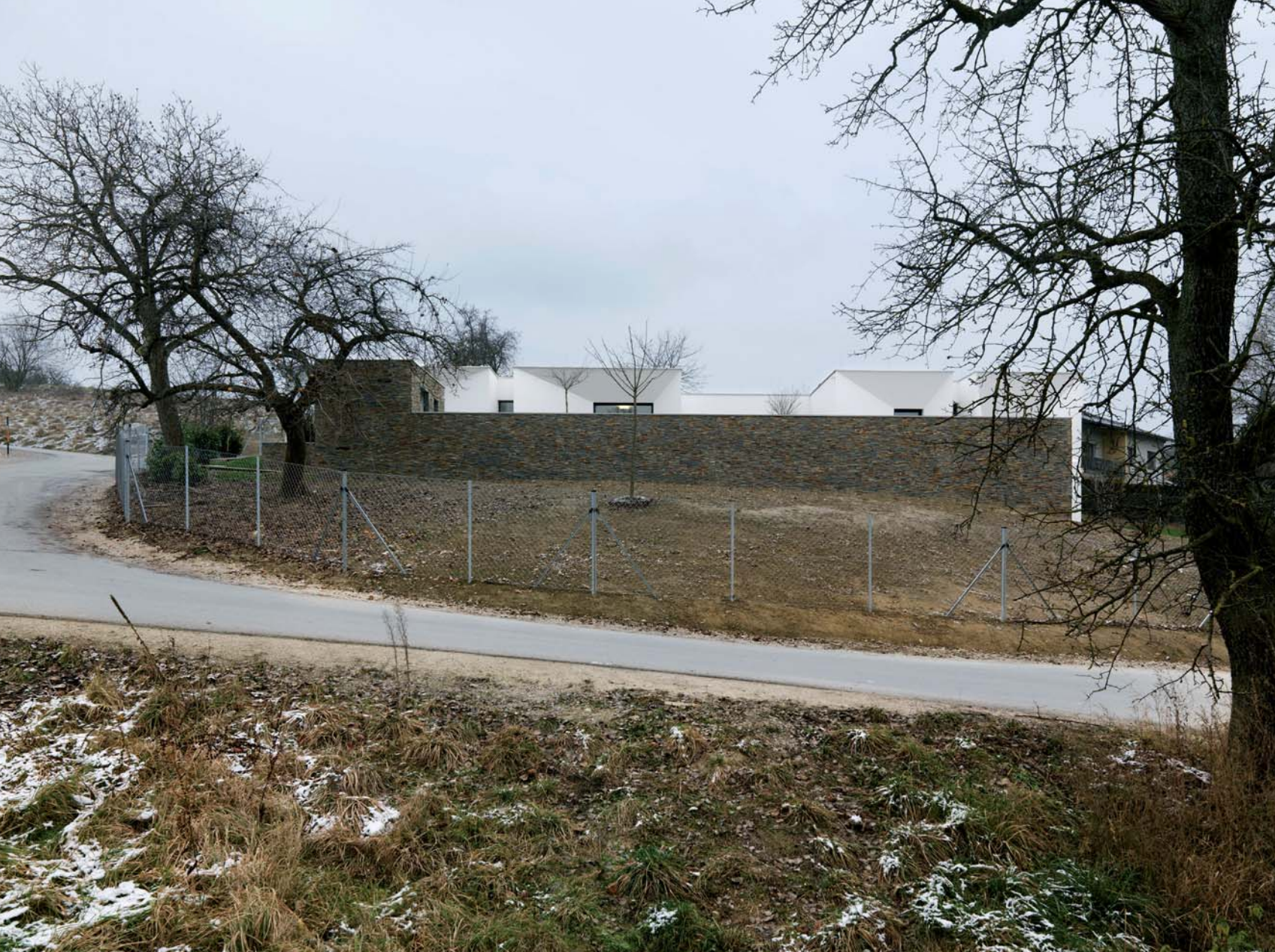
Hertl.Architekten Egger Haus, Oberösterreich, 2009