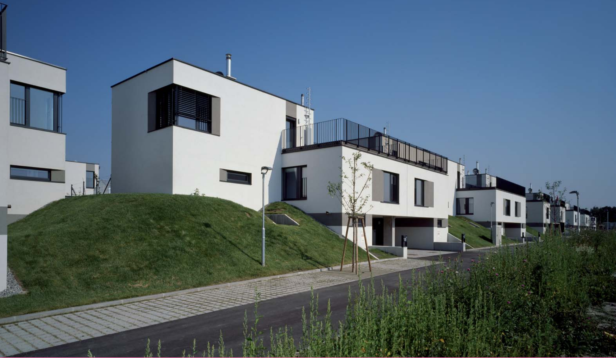
Josef Weichenberger Architects Gartensiedlung „Leben am Obstthain“, Wien, 2009