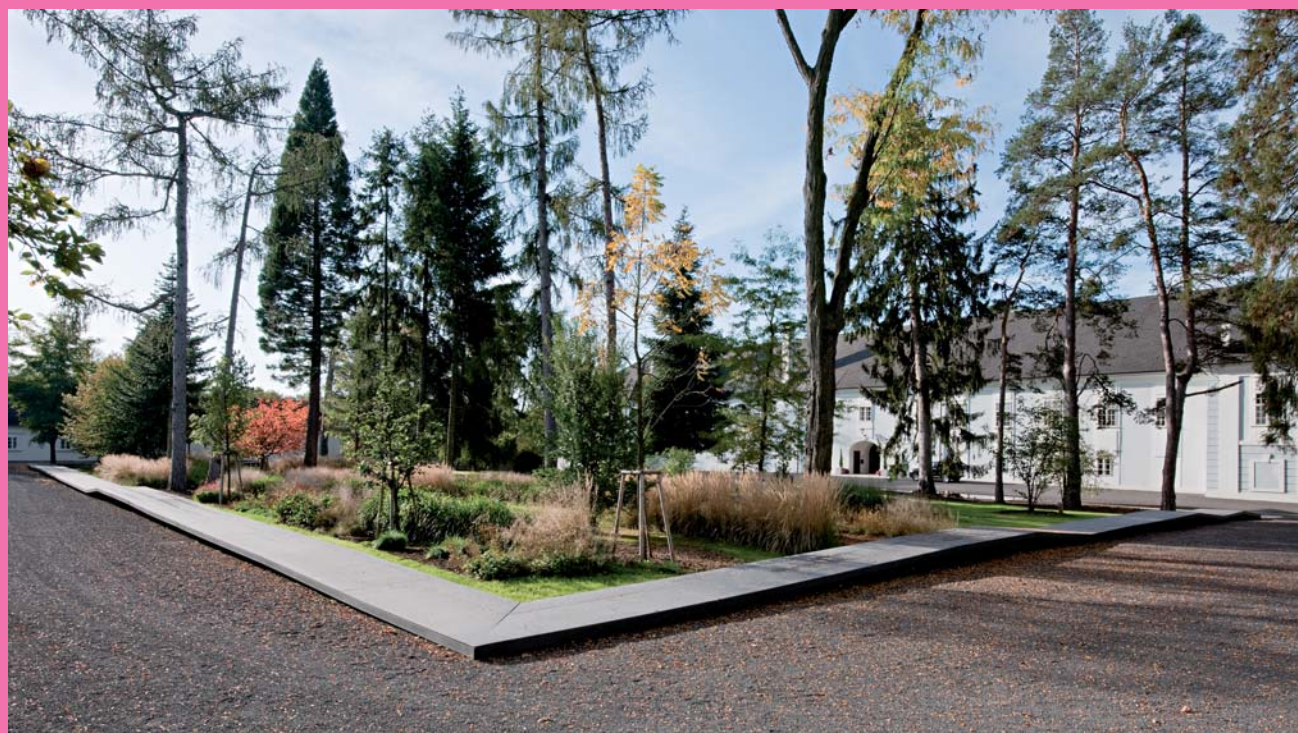
3:0 Landschaftsarchitektur Arboretum Vorpark Schloss Lackenbach Lackenbach, Burgenland, 2007