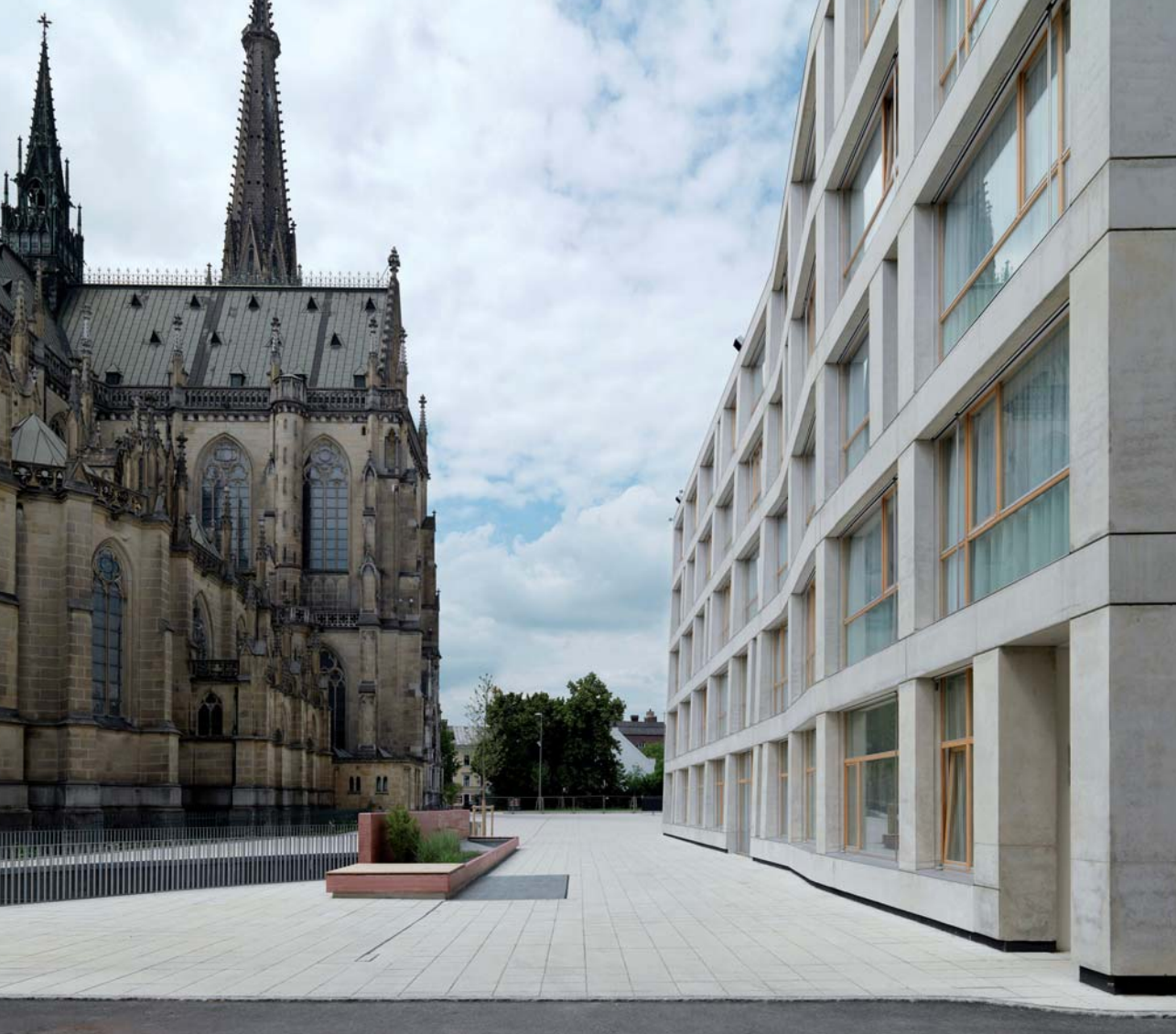
Hohensinn Architektur Hotel am Domplatz, Linz, 2009