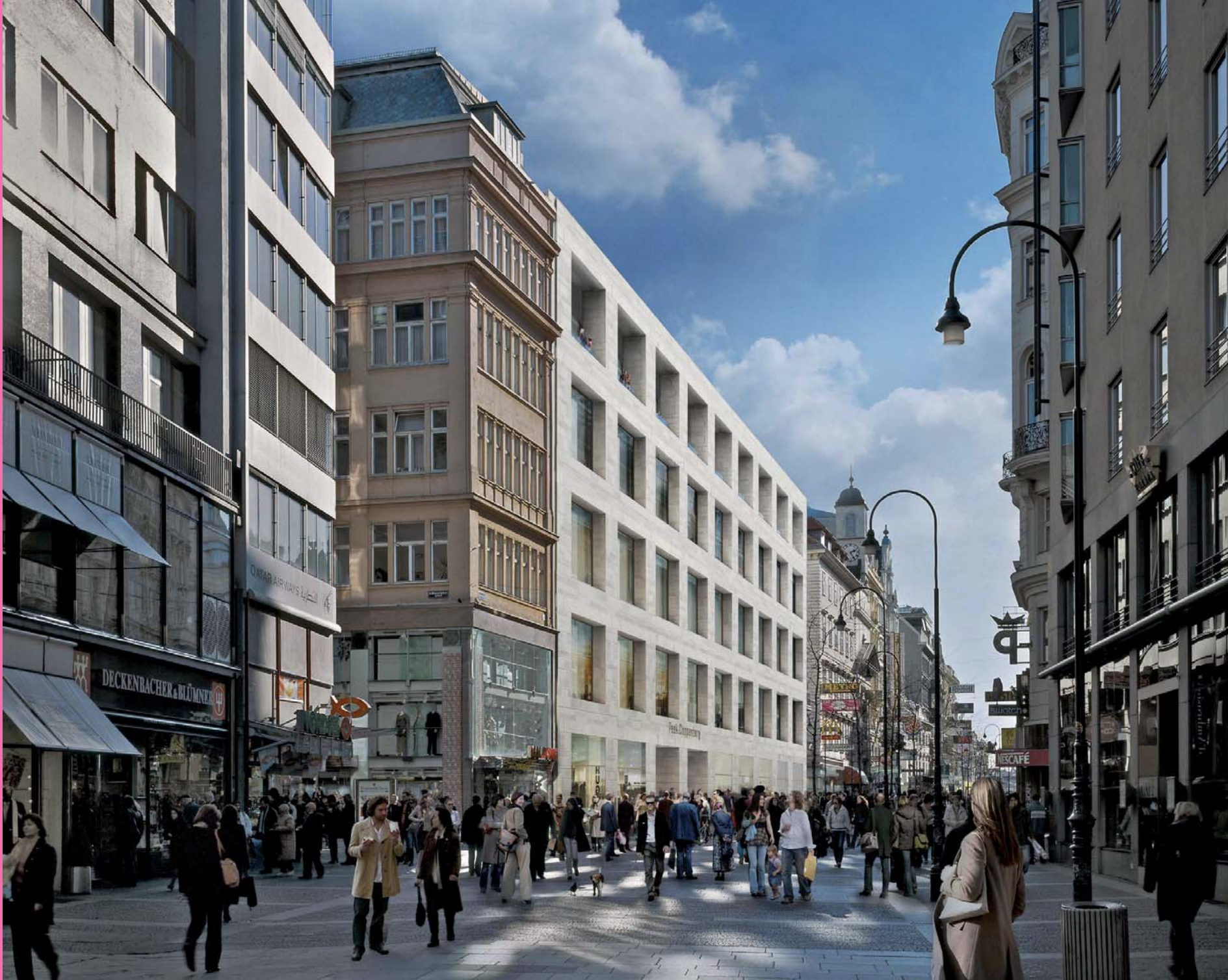
David Chipperfield Architects Peek & Cloppenburg Weltstadthaus, Kärntner Straße, Wien, 2011 Rendering: Jens Gehrcken

Die einzelnen Wohnhäuser setzen sich aus weißen Kuben zusammen, die diagonal aneinandergereiht und zudem höhenmäßig versetzt sind. Umspielt wird diese Komposition von den kleinen Hügeln, dem Obsthain. So wird am Ende eine fast vergessene Geschichte erzählt, von verschiedensten Obstbäumen, die am durchlaufenden Grundstück gepflanzt wurden, und von Glashäusern und Mostkellern, die gemeinsam genutzt werden können. Die Idee ist das eine, die Praxis der Nutzung wird sich zukünftig erweisen.